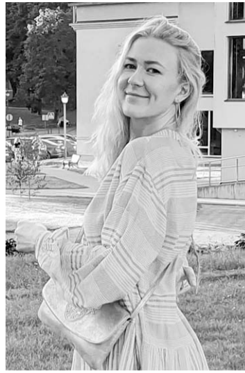
Gerda mano, jog šis virusas gali tapti visų mūsų kasdienybe.

Norintys užsiregistruoti ar užregistruoti kitą asmenį vakcinacijai, gali tai atlikti internetu www.koronastop.lt arba Karštosios li-